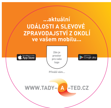
Samolepka pro umístění na dveře