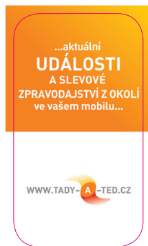
Informativní letáček velikosti vizitky